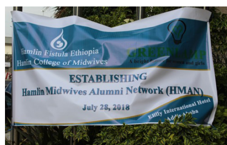
Benämningen Alumni används om fd elever

Värdet av en sådan här satsning kan knappast överdrivas. Att vara barnmorska ute på den etiopiska landsbygden, där ofta traditionella levnadsmönster präglar samhället, är en ständig utmaning. Ibland ingår barnmorskorna i ett arbetslag på en vårdcentral, ibland är de mera isolerade, om än Hamlin Fistula ser till att minst två kollegor finns på samma plats för att täcka behovet av insatser och stötta varandra. De har också tillgång till en handledare, men ett stort ansvar vilar ändå på dem. Att då få tillfälle att resa till huvudstaden och återse sina tidigare kurskamrater, höra hur det går för dem och berätta egna erfarenheter är både stärkande och motiverande för det fortsatta arbetet. Naturligtvis finns det ett behov av vidareutbildning också. Det har ledningen förstått och stöttar den ambitiösa planeringen att skapa